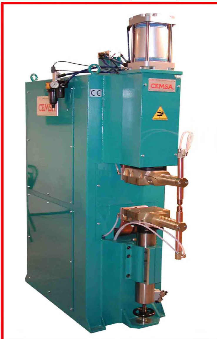
MT - CE